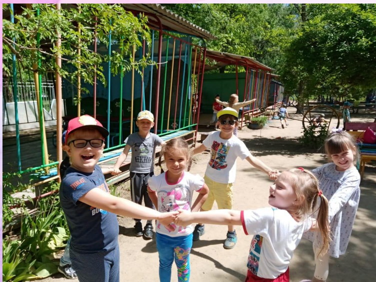
Подвижная игра «Козлята»