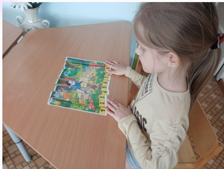
Дидактическая игра «Собери сказку»