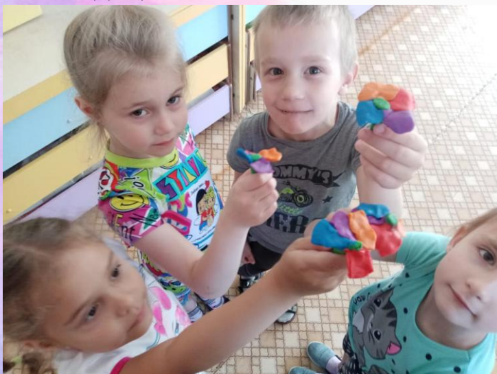
НОД «Цветик – семицветик»